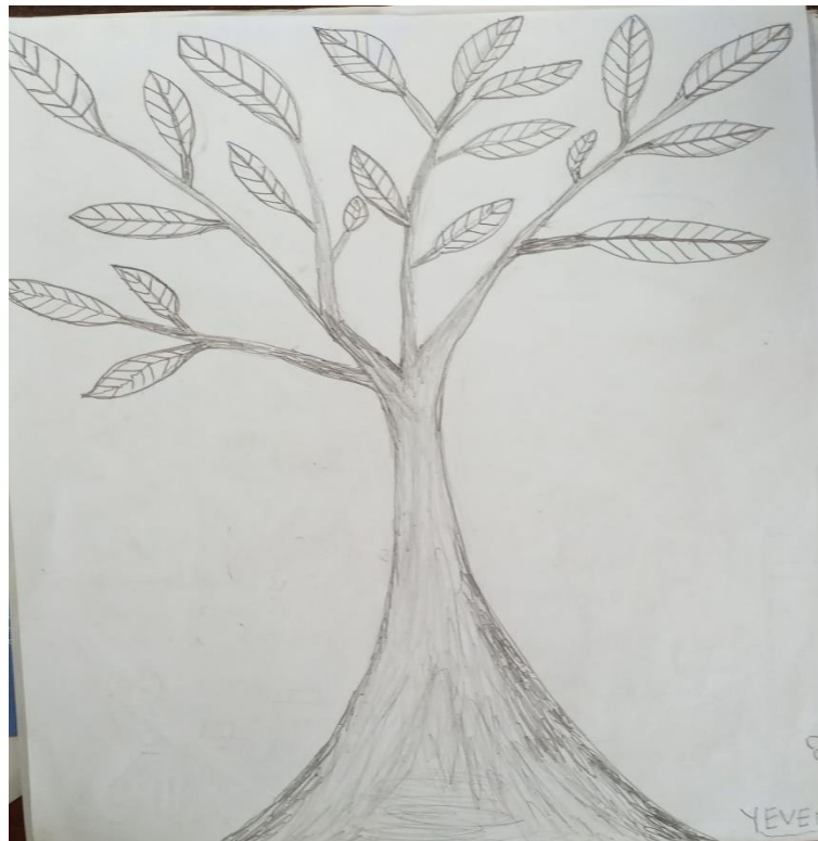
Proposition de l'escalier