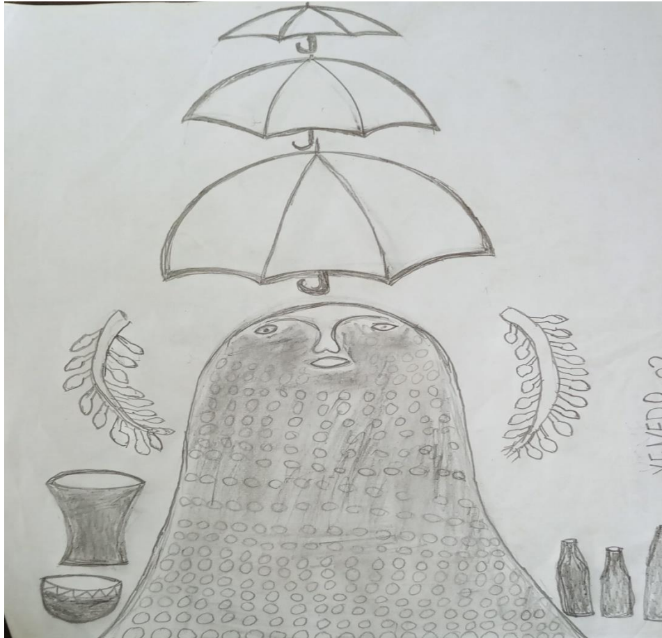
vodun Dan Yêdomin

Les objets de cultes sont constitués de Tchiklè (un bocal en céramique) d'un veron dit talokpémi